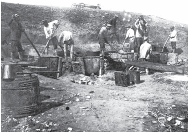
■ На золотом прииске.

Вот как один из томских ученых, географ Г.Н. Потанин описывает те времена: «Все бросились искать золото. Ремесленник бросал свой верстак; чиновник, не стесняясь своим званием, шел служить к мужику-золотопромышленнику; в общественном положении произошла страшная перетасовка... Также он пишет, что вице-губернатор идет в управляющие конторою к купцу, ставшему золотопромышленным тузем. Золотопромышленники же выдвигаются в город-