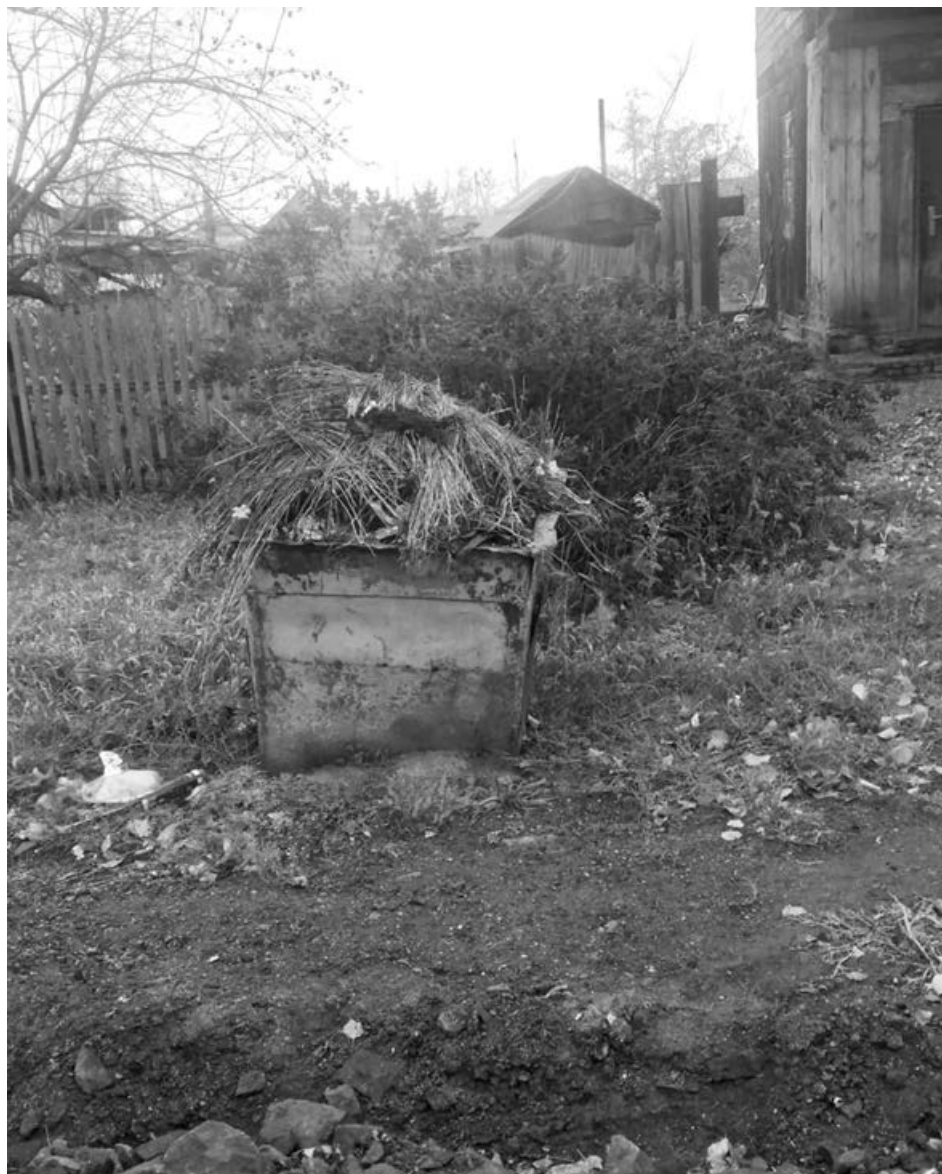
■ К ТКО отнесли отходы, образовавшиеся исключительно в жилье или подобные по составу.