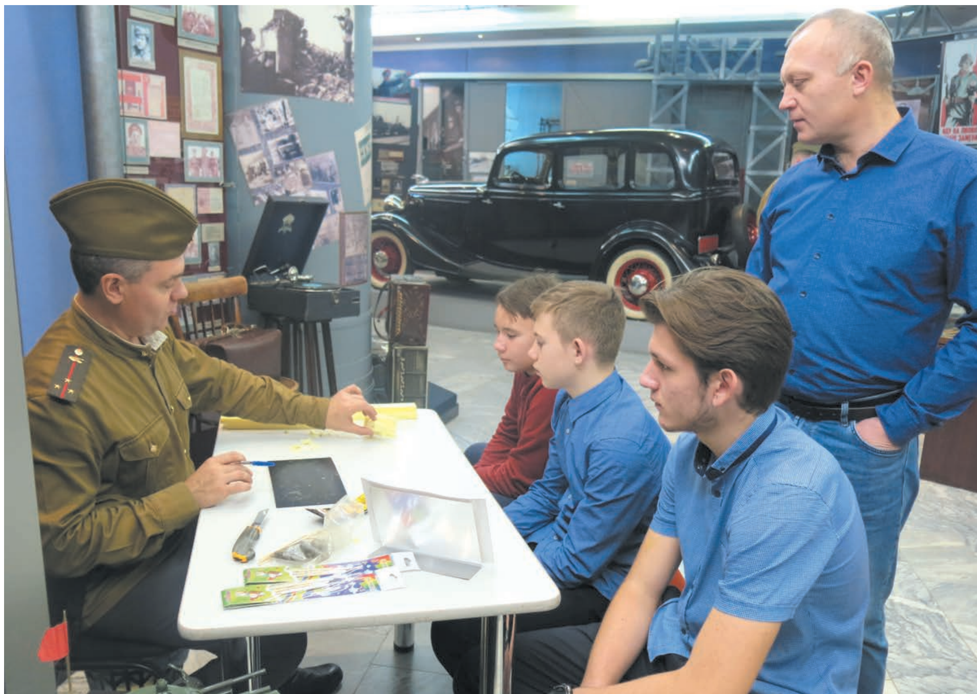
■ «Ночь искусств» в Кемеровском областном краеведческом музее.