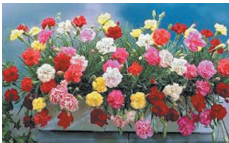
■ Гвоздика Шабо в контейнере и в открытом грунте.

Как правило, Шабо выращивают с двойной пикировкой: в фазе первой пары настоящих листьев, высаживая в более просторные ящички, затем через месяц-полтора, помещая сеянцы в отдельные стаканчики. В грунт переносят, когда минует угроза заморозков. Запомни-