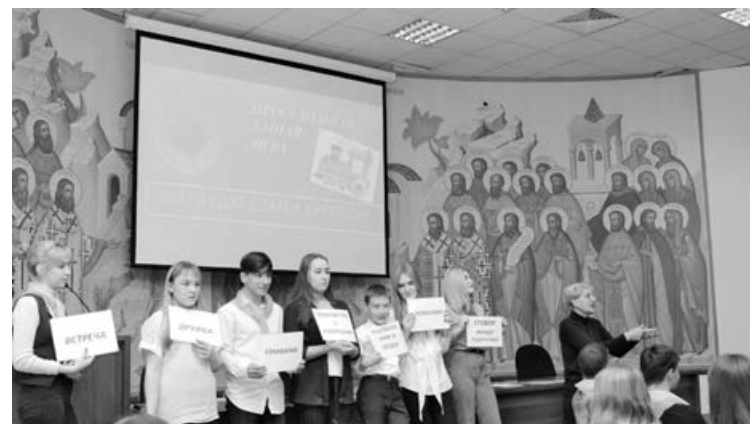
Программа фестиваля включала не только «умные» заседания и стратегические сессии, но и работу молодежных интерактивных площадок.