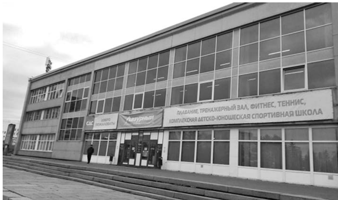
■ Сейчас в УСК «Лазурный» функционирует лишь тренажерный зал.