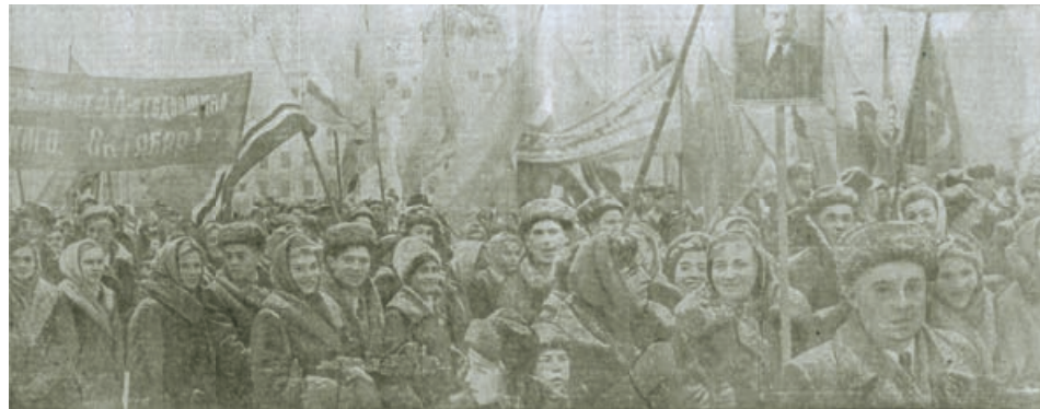
■ Кемерово. Площадь Советов. Демонстрация трудящихся 7 ноября 1961 года в честь 44-й годовщины Великой Октябрьской социалистической революции.

...Все новые и новые коллективы предприятий и учреждений города вливаются на праздничную площадь Советов. Праздник Великого Октября стал волнующей демонстрацией этой неиссякаемой энергии народа, его решимости и воли построить коммунизм.