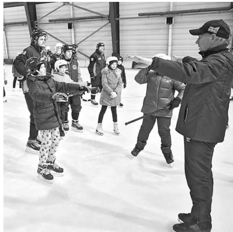
■ Фото Вячеслава Айкина.