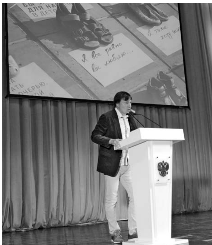
Разговор о том, что социальная реклама должна быть адресной. В молодежной аудитории баннер с посланиями детей, которые уже не родятся, это повод задуматься. На улицах города – жестокость.